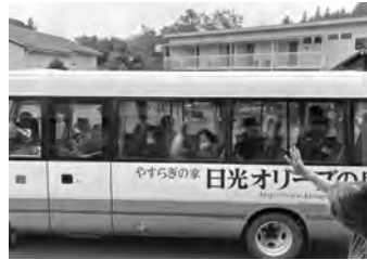
また、お会いしましょう！