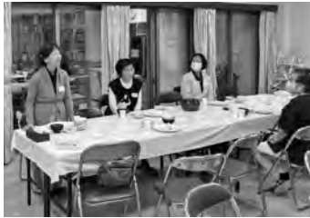
夕食時。黒見姉、病の中、 続けてのご参加、叶いました。 (9ヶ月後、天上の友に)