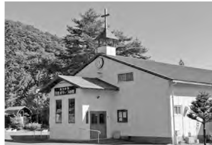
オリーブの里 大チャペル

申込方法 10月21日(木)までに、郵便振替にて、参加申し込みを記入の上、参加費をお納めください。当日でも、キャンセルは大丈夫です。返金もいたします。 申 込 先 523-0894 滋賀県近江八幡市中村町567-2 Fax. 0748-33-8856 (注意ファックス番号です)