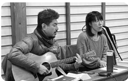
早天祈祷会にも、ギターを背負って 哇道を歩き…讚美♪♪

3日目の夕方に、昼寝から目覚めてギターを弾き始めると、歌詞とメロディーが心に響いてきた。