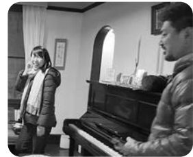
夜、ダブルハウスにて。 出来立てホヤホヤの 讚美を披露♪♪