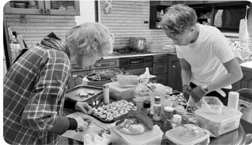
トリートアシュラム最終日は、恒例のクリスマス愛餐会。みんなのカフェち いろば(京都)より大山シェフと悠子母が、美しく美味しいカナッペなど、手作 り下さいました！