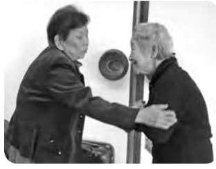
↑2017年、年頭アシュラムにて喜びの再会