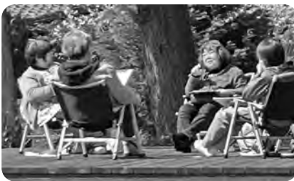
←3月修道場アシユラム。分かち合いの時。シメオン庭にて、春の光と風、感じつつ。