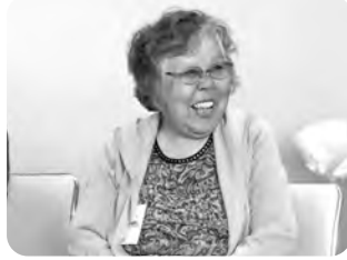
↑2017年5月 金沢アシュラムにて